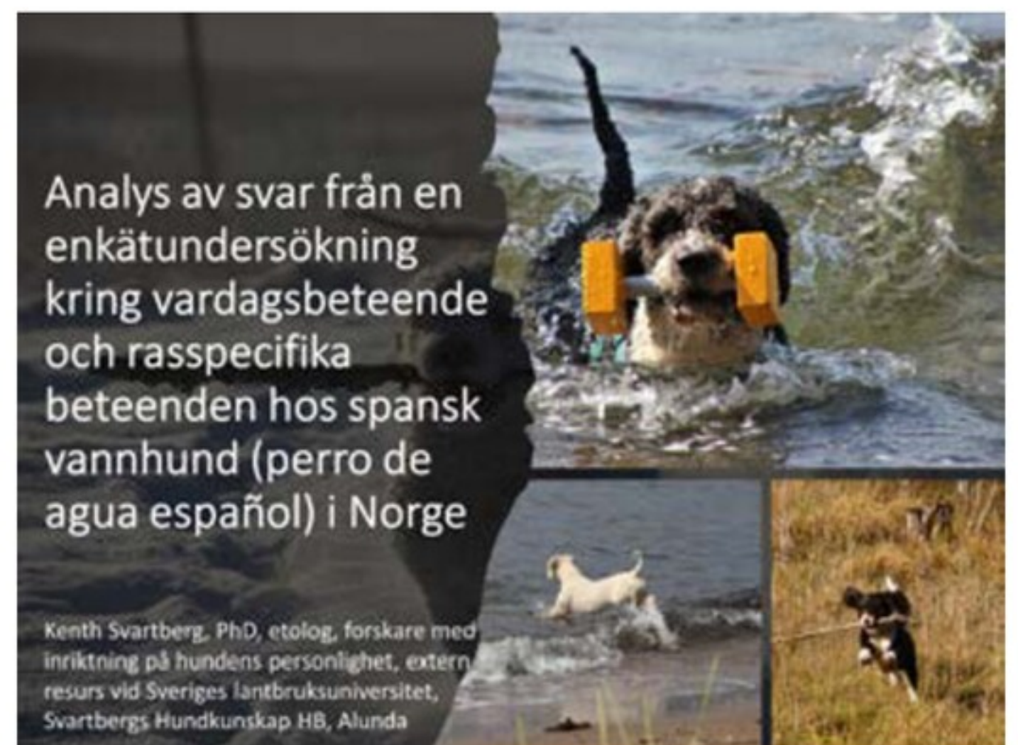
Tittelside fra rapporten til Kenth Svartberg